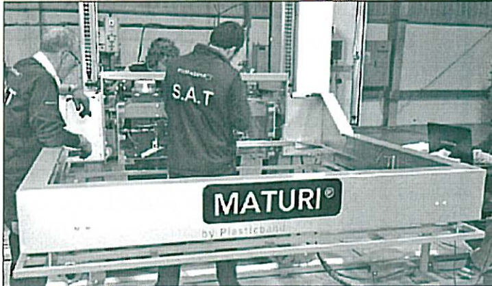
Plasticband exporta fins a un 90% de les màquines d'embarcar que fabrica a Granollers

La firma de Granollers, fundada l'any 1978 per les famílies Guimet i Sisó, ha fet renèixer la marca Maturi, que restava inactiva des de fa 10 anys amb tecnologia actual i un projecte de recerca i desenvolupament propi. Ara acaba de llançar al mercat la segona generació de la màquina fleixadora Maturi