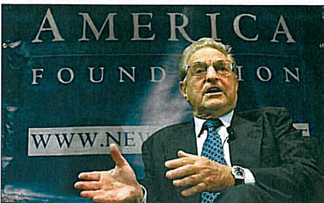
Georges Soros en una imatge d'arxiu

A més, Plasticband preveu que les vendes continuïn baixant, concretament un 5 per cent el 2009. Tot i això, apunta el director de la companyia, la firma es veu menys afectada per la crisi a causa de les exportacions i les millores que es van introduint en el producte final, que van des de la personalització a la millora de la resistència del fleix, pensada per reduir el nombre d'accidents laborals. ■