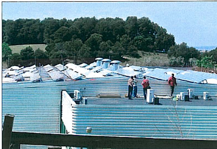
Les plaques solars s'han instal·lat sobre els 1.500 metres de la fàbrica de Granollers

L'adquisició dels quatre centres de plasma permetrà a Grífols disposar de 150.000 litres addicionals per a fraccionar a les seves instal·lacions i convertir-los en hemoderivats. Amb aquesta incorporació, la companyia ja té 79 centres per a l'obtenció de plasma als Estats Units. Grífols, que instal·larà en un futur una de les seves seves corporatives a la masia de Can Guasc de Parets, preveu seguir augmentant el nombre de litres de plasma, a través de la integració de nous centres i l'ampliació dels ja existents. El plasma obtingut es fraccionarà a les fàbriques del grup a Parets i a Los Angeles