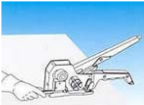
1. Insertar precinto.