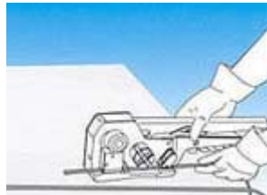
2. Pasar el fleje alrededor del paquete. Presionar la palanca hacia abajo hasta el tope e insertar el extremo del fleje en el precinto.