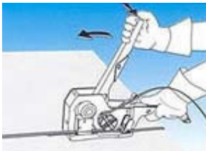
4. Presionar el botón. La misma acción de tensar el fleje, presionará el precinto.