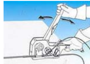
3. Insertar el fleje (desde el dispensador) en el rodillo. Tensar el fleje accionando la palanca.