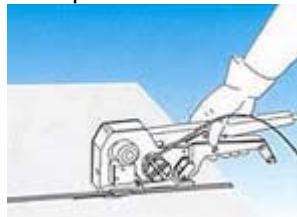
5. Presionar y mantener la palanca abajo (para cortar el fleje) y separar la flejadora del fleje. El proceso de flejado ha terminado.